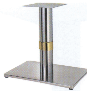
ステンレス(ステンレスパイプ) Gリング