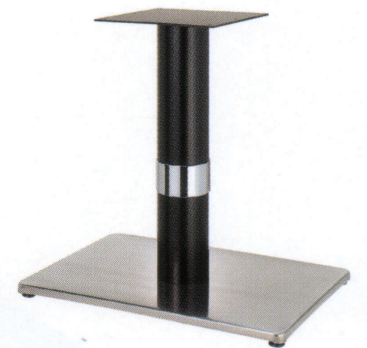
ステンレス(塗装パイプ) Crリング