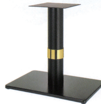
黒粉体(塗装パイプ) Gリング