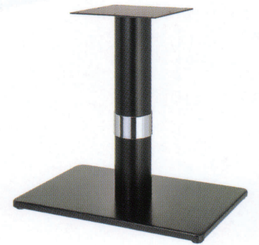
黒粉体(塗装パイプ) Crリング