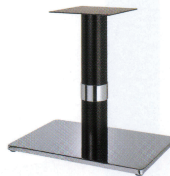
クローム(塗装パイプ) Crリング