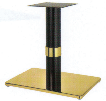
ゴールド(塗装パイプ) Gリング