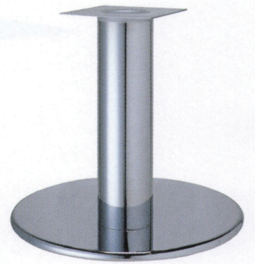
クローム(メッキパイプ)