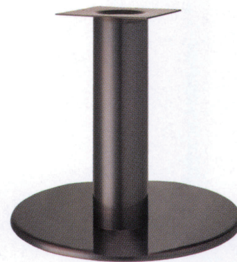
ジービー(メッキパイプ)