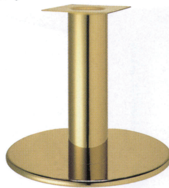
ゴールド(メッキパイプ)