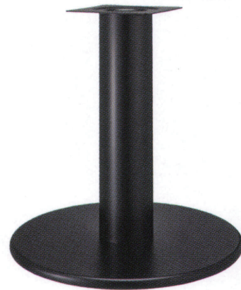
黒粉体(塗装パイプ)