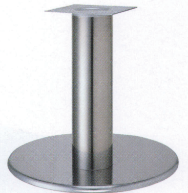
ステンレス(ステンレスパイプ)