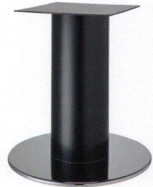
クローム(塗装パイプ)