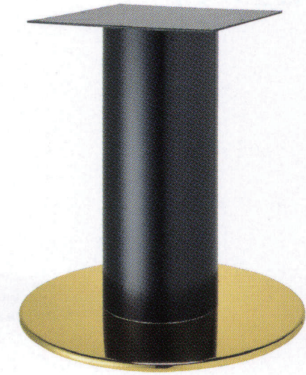
ゴールド(塗装パイプ)