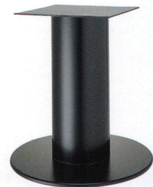
黒粉体(塗装パイプ)