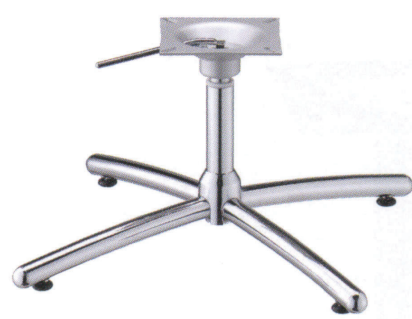
クローム(メッキパイプ)