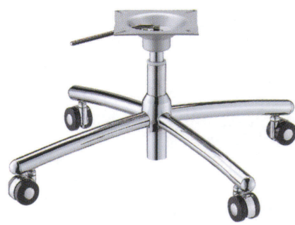
クローム(メッキパイプ)