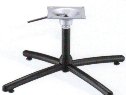
黒粉体(塗装パイプ)

■スチール ■十字 ■SGパイプ(ガス昇降式) 基準色塗装 ●●●●●▶005ページ