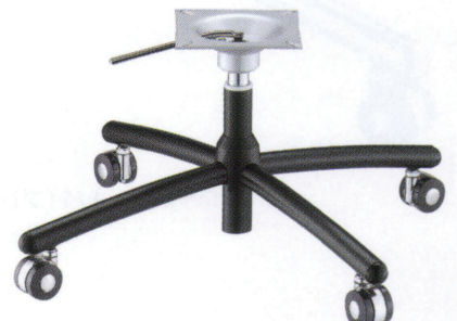
黒粉体(塗装パイプ)

■スチール ■十字 ■SGパイプ(ガス昇降式) 基準色塗装 ●●●●●▶005ページ