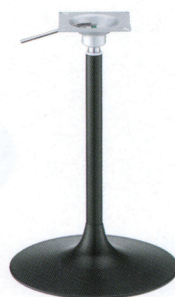
黒粉体(塗装パイプ)