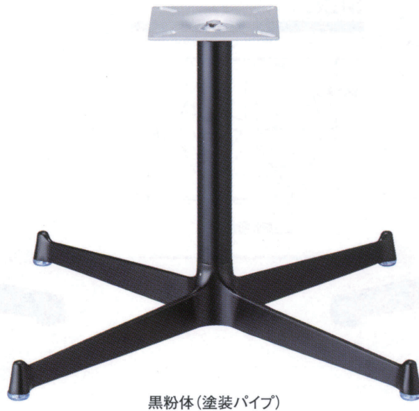
黒粉体(塗装パイプ)