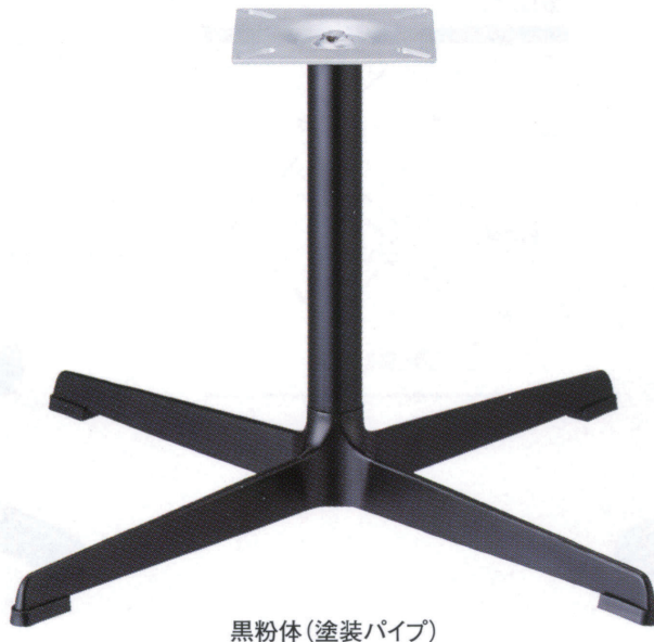
黒粉体(塗装パイプ)