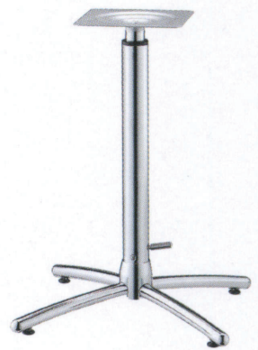
クローム(メッキパイプ)

(別売) No.350 簡易ボックスレンチ ¥700 この製品を組立てるには上記専用工具が必要です。