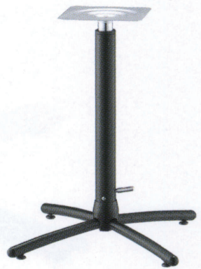
黒粉体(塗装パイプ)